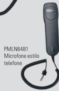
PMLN6481 Microfone estilo telefone