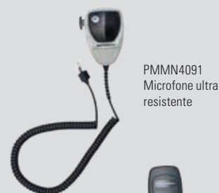
PMMN4091 Microfone ultra resistente